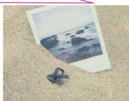
如同太阳会落下 黄昏会落尽归鸟的翅膀

路上风景太多 构成一幅完美的画卷 睁开眼的时候 许看见阳光向我伸出手 就能感受 世界上最渺小的莫过于悲伤 我们是彼此路上同行的人 如果有一个世界 浑浊的不像话 我会疯狂的爱上