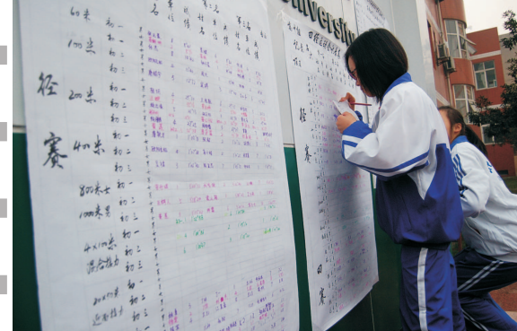
裁判员正在细致工作