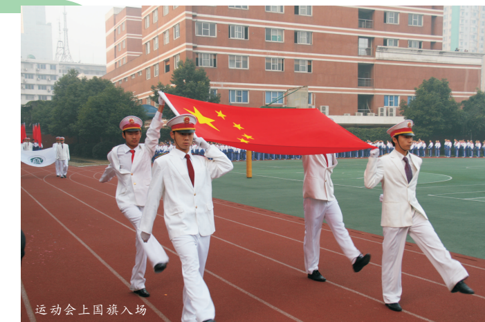
运动会上国旗入场