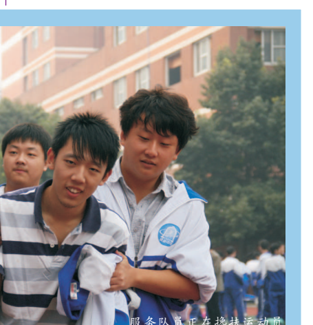
服务队正在帮扶运动员

运动会正在进行,同学们挥动着手中的笔,为运动员们谱写胜利乐章,为运动员们在心灵的殿堂里吹起凯旋的声。因为她们知道,她们的汗水与辛苦,不会白白浪费,看着那一个个认真的表情,散发出必胜的决心、胜利的辉煌,就仿佛看到了已在身边的荣誉,已在门外的骄傲。只怕与它们,擦肩而过。