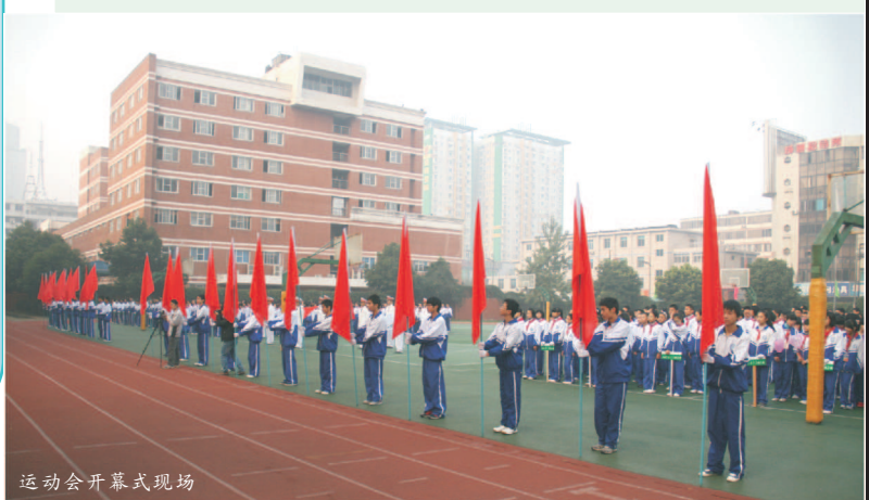
运动会开幕式现场

在期待中，在意料中，是悲是喜，是欢是狂，但可知的是我们拥有这样一场运动盛会。我们曾经不计成本地付出，都在这和梦碰撞的季节里得到肯定。虽然我们也不想登上领奖台，也想得到祝贺英雄的掌声，但结局并不重要，让我们从中获得，我们就满足了！