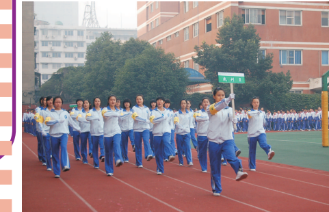
运动会裁判员方队