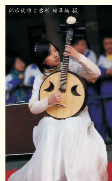
阮乐优雅古韵新

快的音乐声，在操场上回荡。当第二个节目报出时，操场的同学们都沸腾了，一窝蜂地冲到才艺区，把才艺区围得内三层外三层，害得台上的同学脸都红了起来。伴奏响起，一阵低沉而又 乏生动的歌声萦绕在耳边：“一场雨，把我困在这里，你冷漠的表情，会让我伤心……”让大家不得不由衷地发出感叹。歌曲还是万花丛中可以各取所好，参加自己感兴趣的活