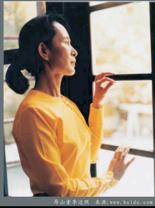
昂山素季近照