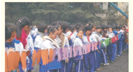
国学游园好热闹

有，但仍然其乐融融。上完一天的课，回到宿舍。大家坐下来，谈一谈在学校发生的种种趣事，谈一谈自己发的“新闻”。