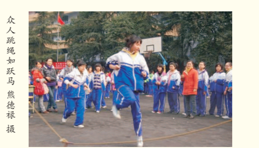
众人跳绳如跃马

在这次“游园会”中，全体同学可说是玩得“不亦乐乎”。当然我也是积极参与当中。我参加的游园项目是我最爱以及我最擅长的跳绳。所以，它（跳绳）也是最让我记忆犹新的项目。